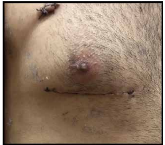
Resim 1. Sağ mini torakotomi ile sekondum atrial septal defekt tamiri yapılan 29 yaşında erkek hasta (Ameliyat sonrası 7. Gün).

yöntemini tercih ettik. Bir hastada süperior vena kavanın perkütan kanülasyonuna bağlı acil sternotomi gerektiren laserasyon tespit ettik. Bunun dışında hiçbir hastada periferik kanülasyona bağlı vasküler komplikasyon veya yara yeri problemi gözlemedik. Klinik tecrübemize göre internal juguler ven