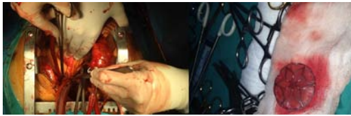
Resim 2: Pulmoner arteriyotomi sonrası cihazın çıkartılması ve intraoperatif cihazın görünümü.